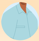
VÊTEMENT DE PROTECTION