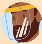
LUNETTES DE PROTECTION