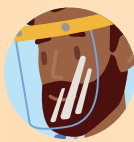
LUNETTES DE PROTECTION