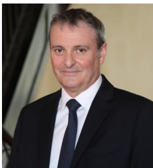
Jacques Billant Préfet de La Réunion

Depuis plus d'un an, nous sommes mobilisés dans la lutte contre la Covid-19. Nous avons mené plusieurs batailles et jusqu'alors La Réunion a résisté grâce à la mobilisation de tous. Un an d'efforts, d'engagement, d'angoisse, d'épreuves qui nous ont permis de tenir ensemble et de lutter contre la Covid-19.